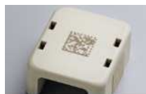
対象ワーク：ABS樹脂 印字内容：データマトリックス