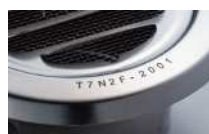
対象ワーク：ステンレス建材 印字内容：ロット番号