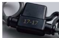
対象ワーク：PVC樹脂 印字内容：識別情報