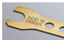
対象ワーク：真鍮電極 印字内容：シリアル番号