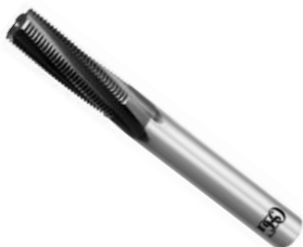
プラネットカッタ

▶ PVDコーティング技術の向上により、密着性向上と逃げ面摩耗が均一になる特性を発揮します。